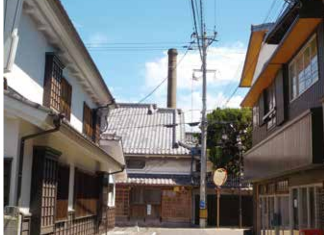
家が千軒建つほど繁栄していたため「津屋崎千軒」と呼ばれた街並み