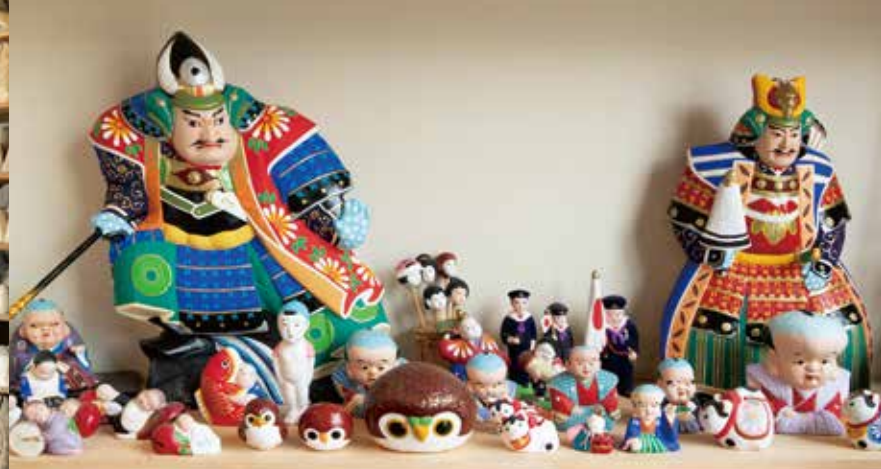
モマ笛をはじめ、武者人形や、赤ちゃんのおしゃぶり人形「ごん太」など種類豊富