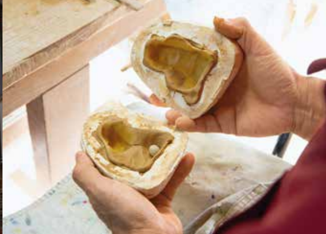
2枚の型を合わせて割れにくくするためには、熟練の技が必要